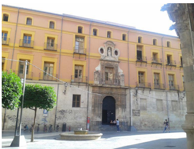
Fachada del Seminario Mayor de San Fulgencio sede de la Escuela Superior de Arte Dramático de Murcia.